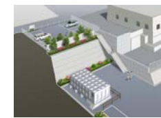
MLIT Kanto Bldg. Dep. Nagano Pref. Police School Auditorium Renovation Design