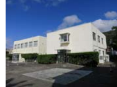
平成29年(2017) 国交省関東地整 営繕部 新島簡易裁判所耐震改修設計