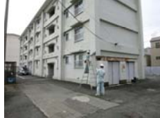
国交省関東地整 川崎国道事務所 多摩宿舎B棟改修設計