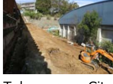
所沢市 山口中学校体育館アリーナ棟 災害復旧構造検証