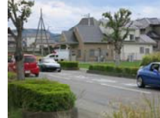
埼玉県警 金屋駐在所設計