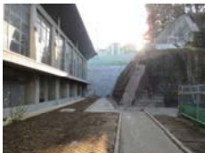
所沢市 山口中学校既存擁壁改修積算