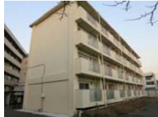
国交省関東地整 川崎国道事務所 梶ヶ谷宿舎改修設計