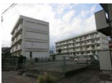
平成30年(2018) 国交省関東地整 首都国道事務所 柏旭町宿舎改修設計