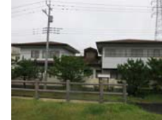
国交省関東地整 霞ヶ浦河川事務所 会議棟+車庫棟屋根改修設計