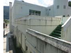
国交省関東地整 営繕部 長野県警察学校講堂棟改修設計