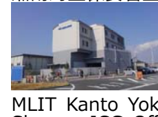
国交省関東地整 横浜営繕事務所 湘南海上保安署工事監理