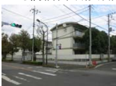
国交省関東地整 首都国道事務所 西馬橋宿舎改修設計