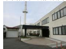
国交省関東地整 霞ヶ浦導水工事事務所 庁舎防水改修設計