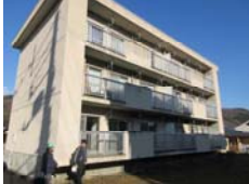
埼玉県警 小鹿野待機宿舎防水改修設計