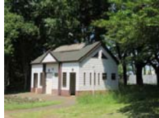
埼玉県 彩の森入間公園トイレ棟改修設計