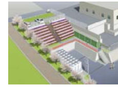
平成28年(2016) 所沢市 衛生センター改修設計